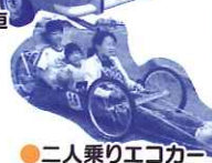
●二人乗りエコカー