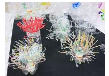
「ペットボトルの森、めぐる」