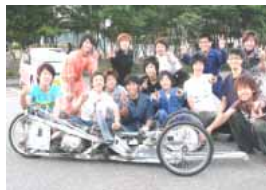
ゼッケン：8 長野工業高校3年生チーム 記録：なし