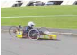
ゼッケン：6 清水中学校チーム 記録：96.57km/l