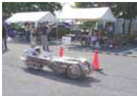
ゼッケン：16 長野工科短期大学校 記録：6.57km/l(参考記録)