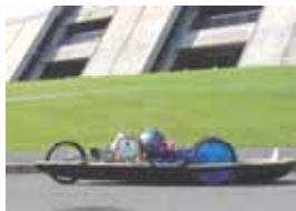
ゼッケン：9 長野工業高校1年生チーム 記録：224.76km/l 表彰：優秀賞