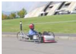
ゼッケン：10 飯田工業高等学校 J5 記録：103.84km/l 表彰：努力賞