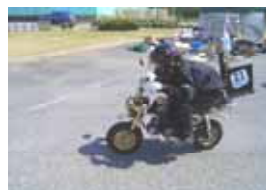
ゼッケン：21 Z50J (市販車部門) 記録：115.74km/l