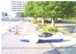
ゼッケン：18 Team Imawaka 記録：136.42km/l