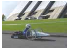
ゼッケン：7 中野平中学校チーム 記録：なし 表彰：奨励賞