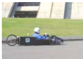
ゼッケン：22 飯田工業高等学校 SKY 記録：106.84km/l