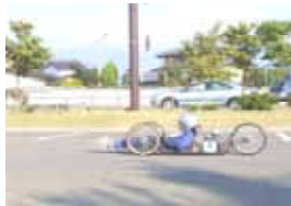
ゼッケン：3 篠ノ井西中学校チャレンジャー2nd 記録：208.41km/l