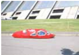
ゼッケン：1 篠ノ井西中学校Spirit 記録：167.14km/l(参考記録)