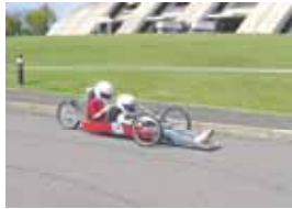
ゼッケン：14 JELUTION@長野高専 記録：8.30km/l(参考記録)