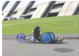
ゼッケン：2 篠ノ井西中学校 Creation Delta 記録：155.81km/l(参考記録)