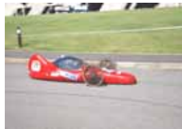
ゼッケン：17 松本お祭り同好会 記録：175.52km/l