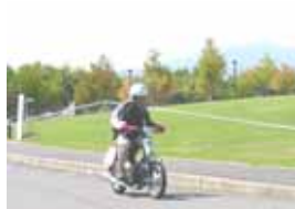
ゼッケン：20 篠ノ井西中学校Team T (市販車部門) 記録：63.64km/l