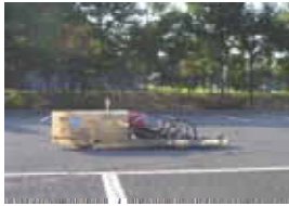
ゼッケン：11 武蔵工大二高 原動機部 記録：131.95km/l