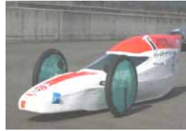
ゼッケン：5 篠ノ井西中学校 M3 記録：なし