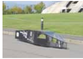
ゼッケン：4 篠ノ井西中学校 Team S&V 記録：10.74km/l(参考記録)