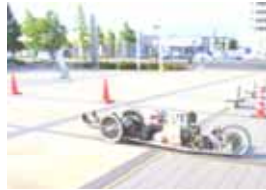
ゼッケン：12 accident@長野高専 記録：198.42km/l(参考記録)