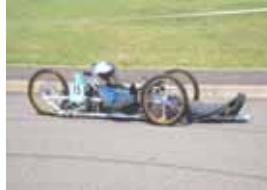
ゼッケン：15 カレッジオブキャリア自動車部 記録：12.36km/l(参考記録)