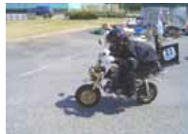
ゼッケン：21 Z50J (市販車部門) 記録：115.74km/l