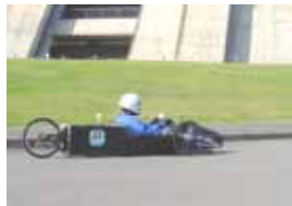
ゼッケン：22 飯田工業高等学校 SKY 記録：106.84km/l