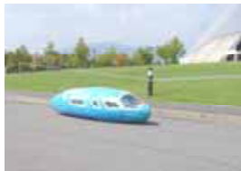
ゼッケン：19 篠ノ井西中学校OB Creation 記録：515.11km/l 表彰：最優秀賞